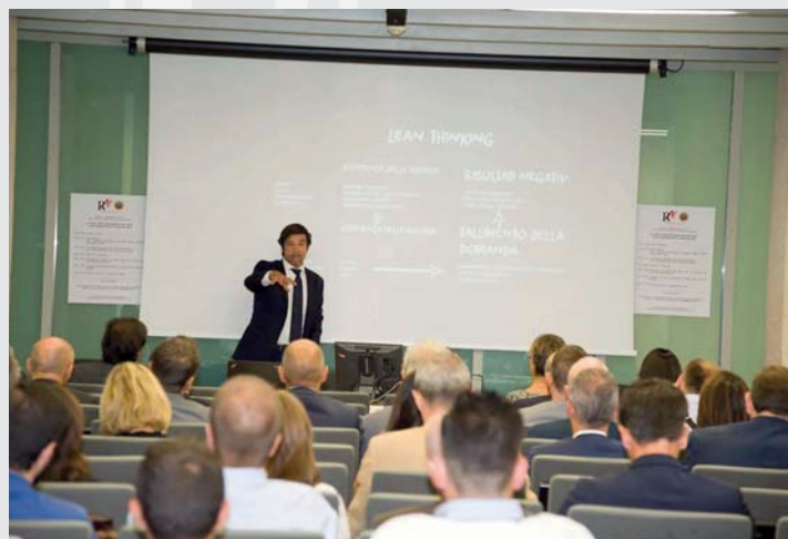
Cerimonia Conclusiva del Corso, 11 settembre 2015